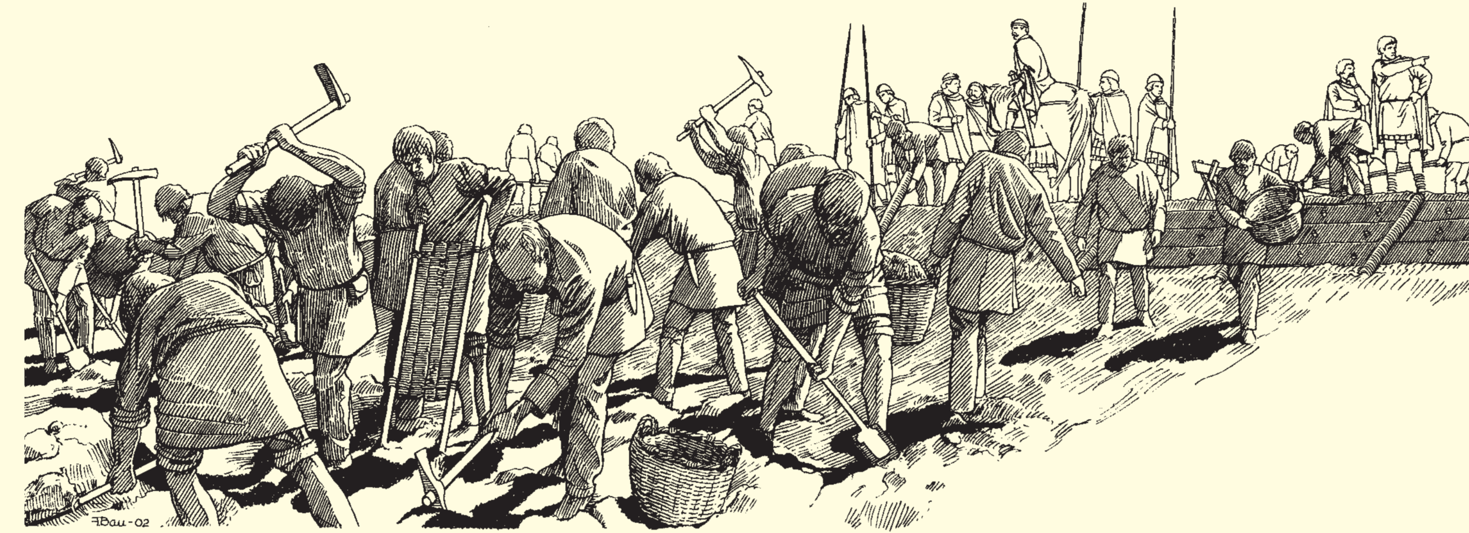
Der Vorwall besteht aus einem Graben und einer dahinter liegenden Erdaufschüttung. Die Arbeiten ließen sich mit einfachen Werkzeugen und Hilfsmitteln bewerkstelligen.

Die so umschlossene Fläche ist etwa 140 ha groß. Damit ist die Sieburg flächenmäßig die größte Befestigungsanlage Hessens.