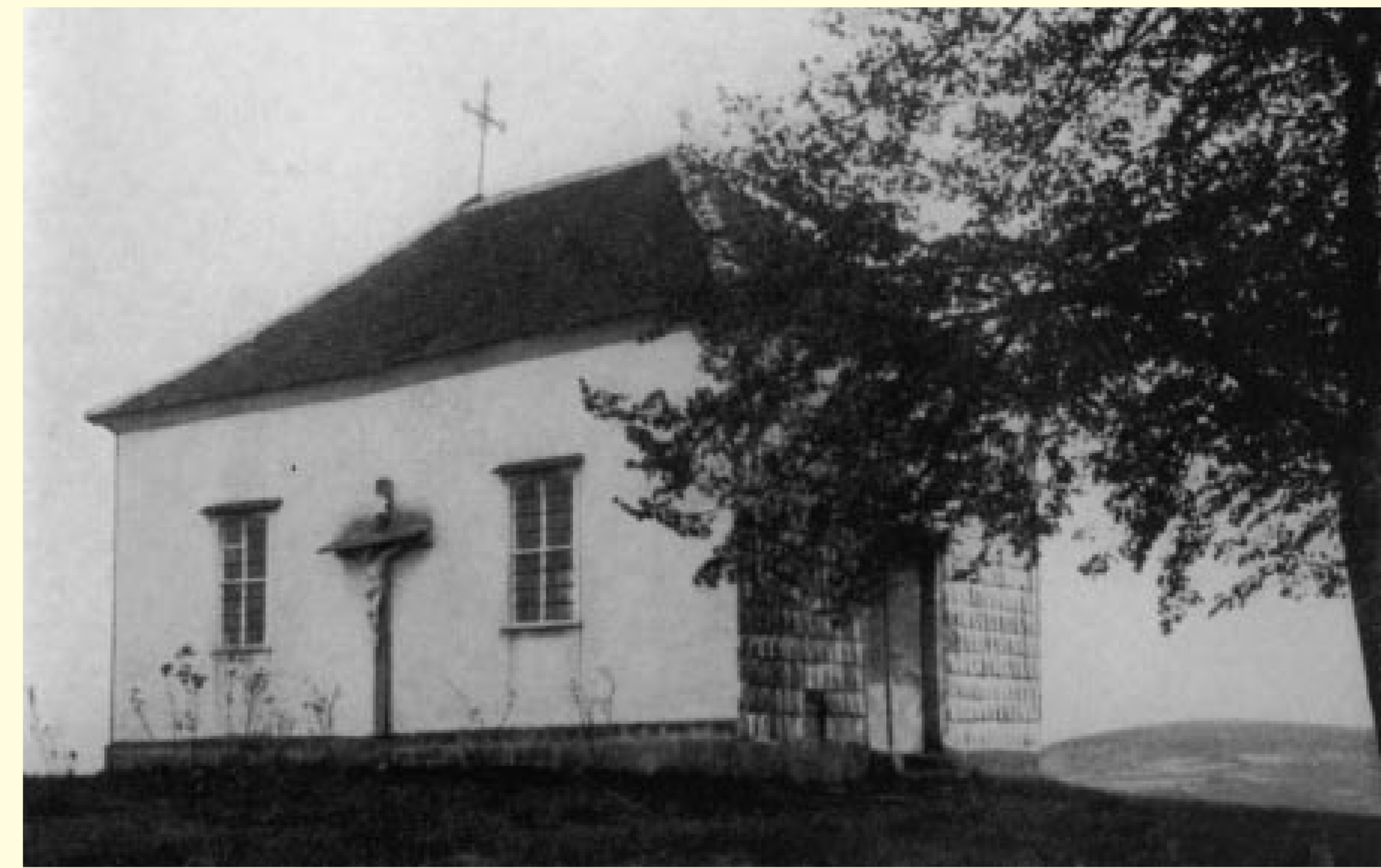
Das Foto von 1911 zeigt die alte Weingartenkapelle, die zwischen 1828 und 1830 erbaut wurde.

Das erste Gotteshaus dürfte zwischen 1733 und 1739 erbaut worden sein. In diesem Zeitraum war Franz Asselen Kaplan in Naumburg, der eine Stiftung zum Erhalt der Kapelle einrichtete. 1760 ist sie erstmals urkundlich erwähnt.