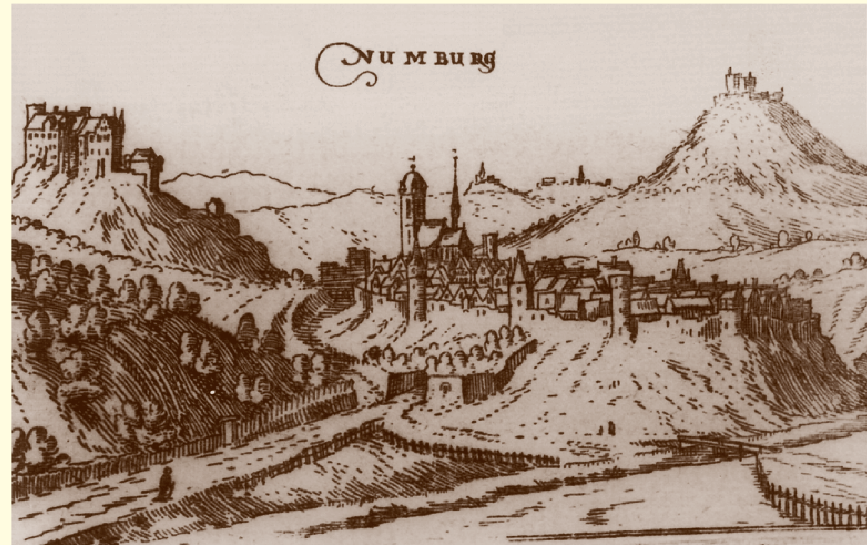
Stadtansicht von Wilhelm Dilich aus dem Jahr 1605; auf der linken Seite ist die Naumburg abgebildet, im Hintergrund ist die Weidelsburg zu sehen.

Der Burgname leitet sich von castrum novum (1182 erwähnt) oder castrum Nuwinburg (1187 genannt) ab. Die „Neue Burg“ steht damit in einem zeitlichen Verhältnis zur benachbarten älteren Weidelsburg. Deren erste Gründung geht nach den Keramikfunden ins 7. oder 8. Jahrhundert zurück.