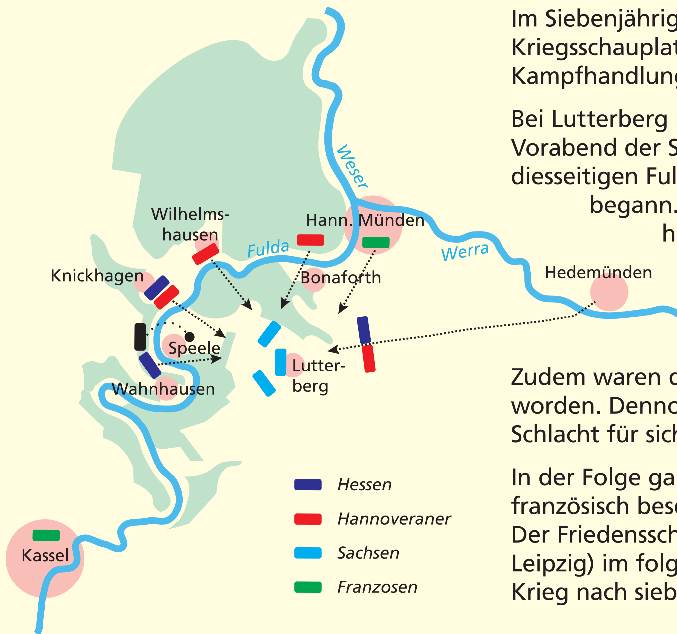
Aufstellung und Bewegungen der Truppen während der Schlacht bei Lutterberg am 23.06.1762.