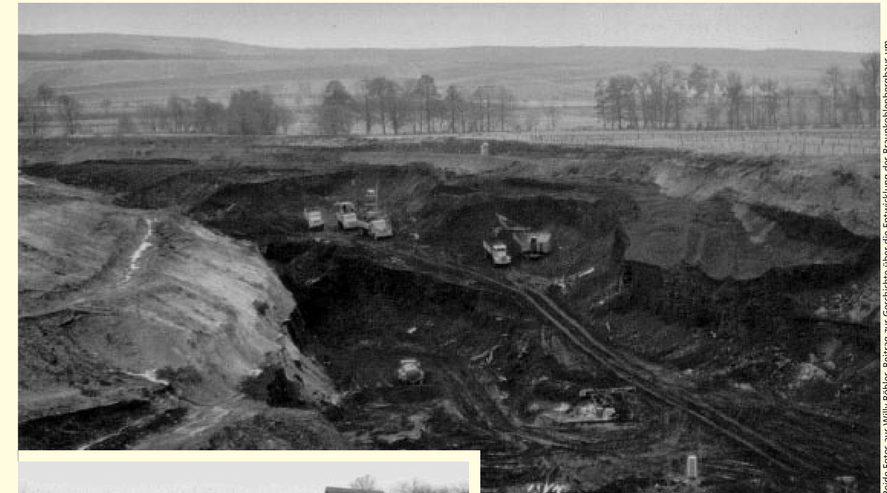
Oben: Tagebau im Steinertfeld um 1960.

Nach 1700 beginnt in Kaufungen der Abbau von Braunkohle, obwohl sie schon im 16. Jahrhundert in Hessen bekannt war. Der Brennstoff weiterhin war Holz. Erst neue Techniken Anfang des 19. Jahrhunderts und Holzknappheit verhalfen der Braunkohle zum Durchbruch. Durch die Verdrängung durch Heizöl und Erdgas ab der 2. Hälfte des 20. Jahrhunderts begann das große Zechensterben in Deutschland.