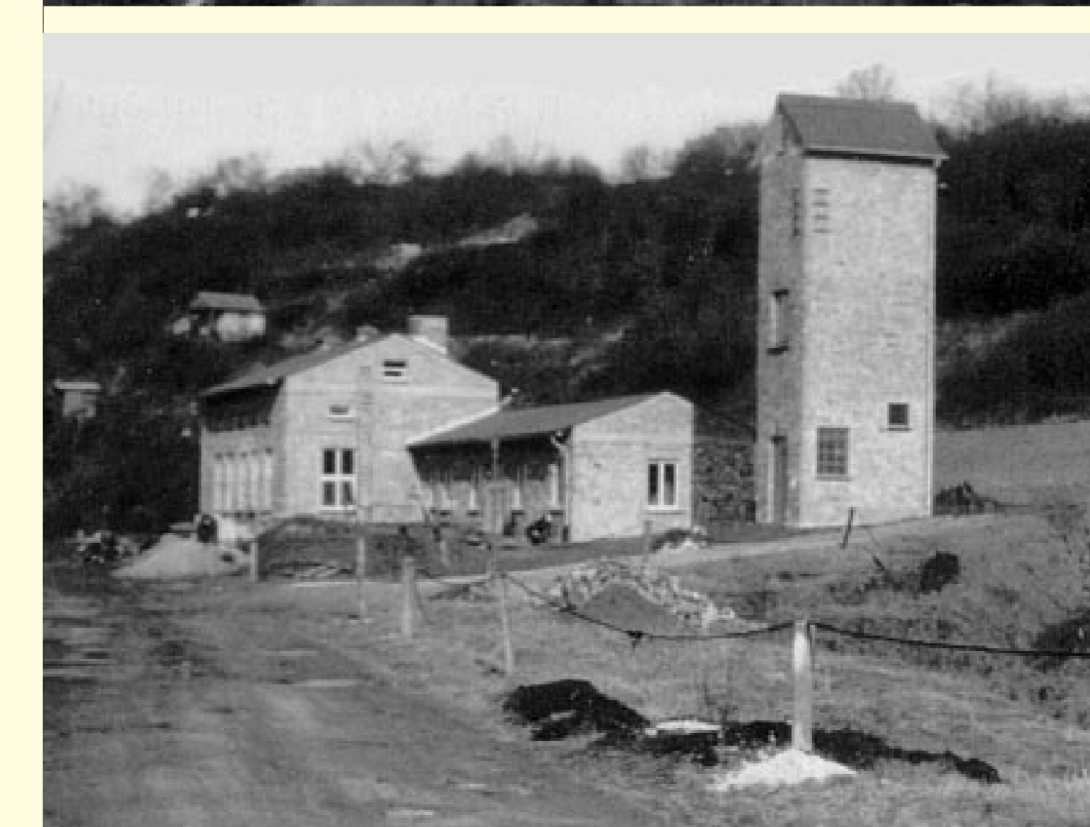
Links: Bau der Waschkaue am Steinertfeld 1952.