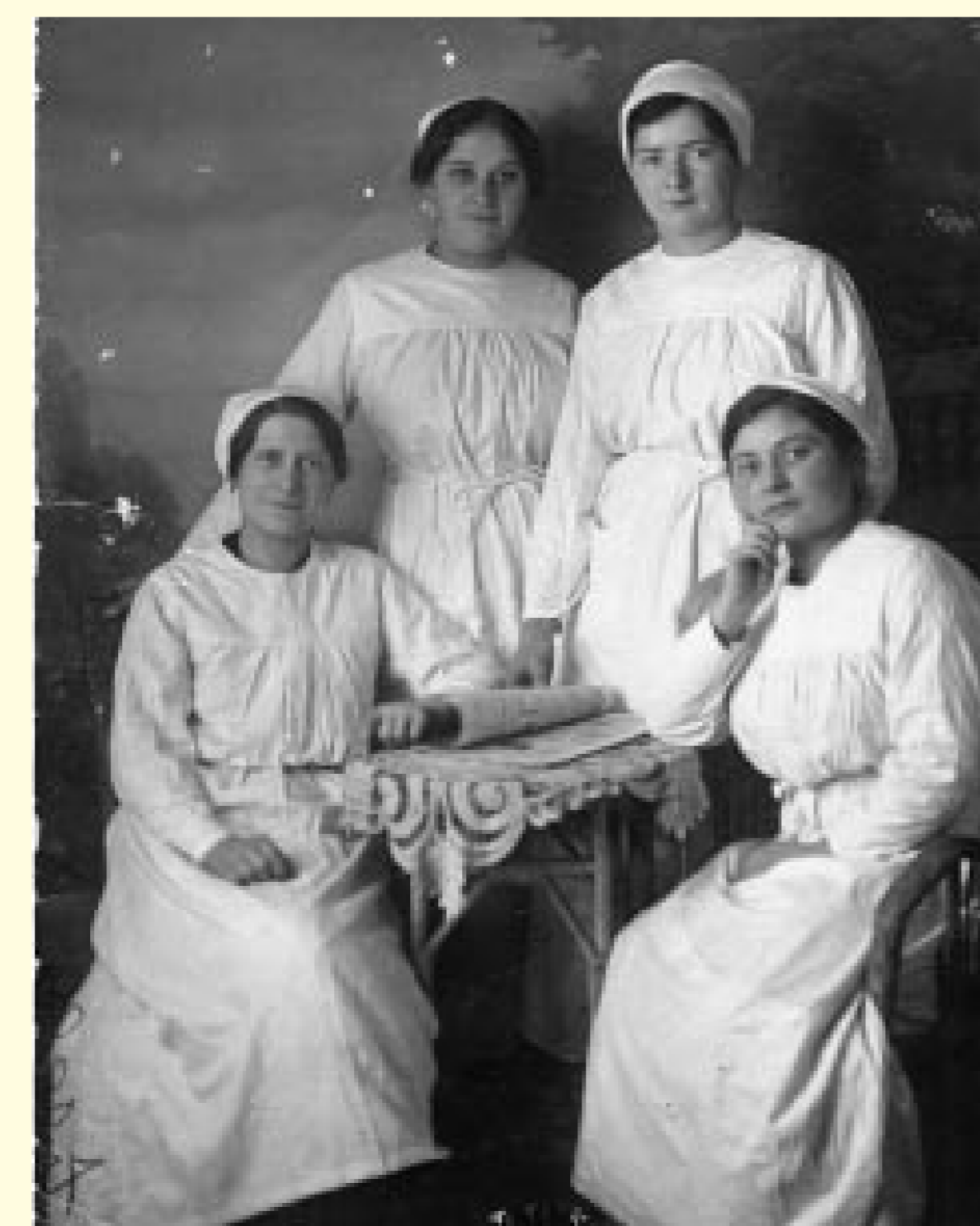
Helferinnen aus Helsa im Genesungsheim 1918

von 272.000 Reichsmark wurde durch die Mietzahlungen des Staates beglichen. Der entsprechende Mietvertrag für das 1912 eingeweihte Militärgenesungsheim, im Volksmund liebevoll „Genese“ genannt, war bis 1934 begrenzt.