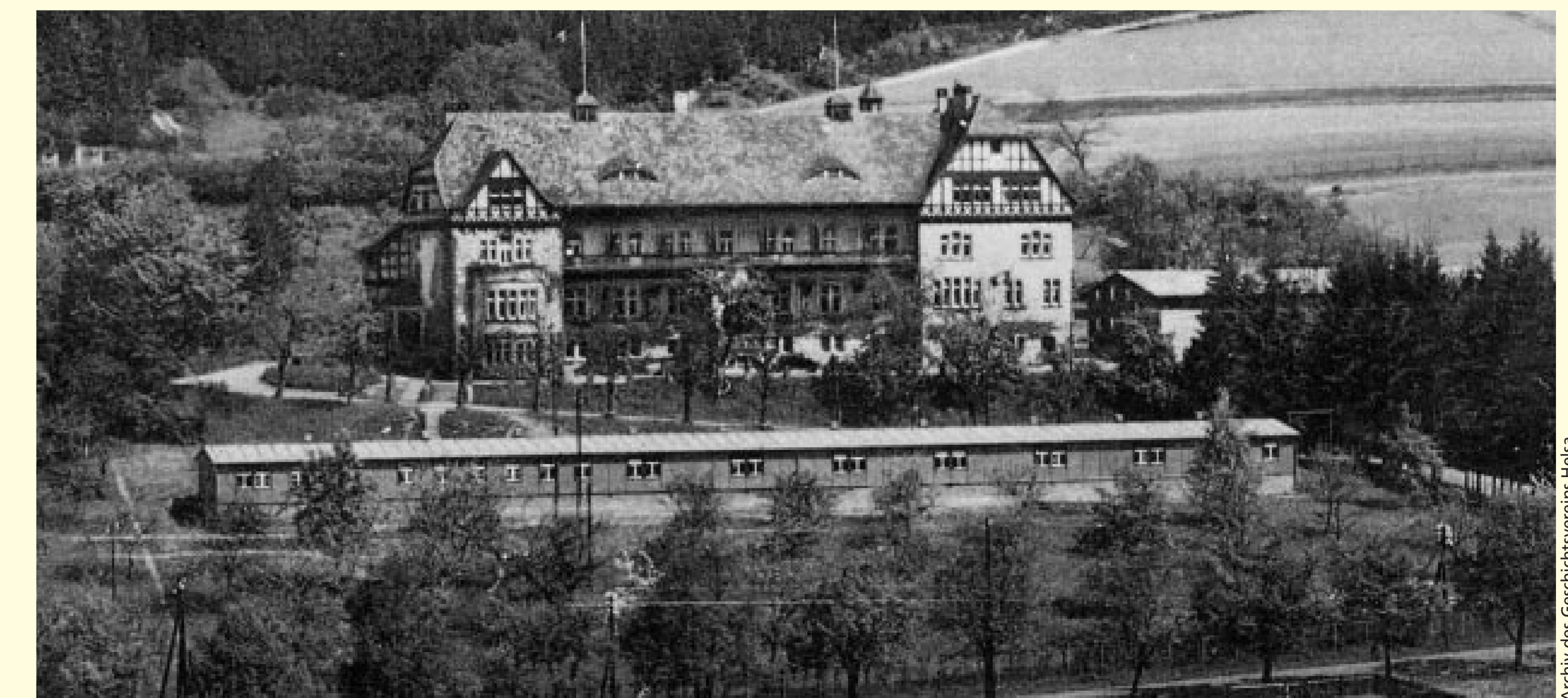
Motorsportschule des Nationalsozialistischen Kraftfahrerkorps 1934

1994 kaufte der Hamburger Unternehmer Wilhelm Kuhrt die gesamte Anlage und gründete nach weiteren Baumaßnahmen das heutige Senioren- und Therapiezentrum mit großzügigen Wohneinheiten und modernen Pflegeangeboten.