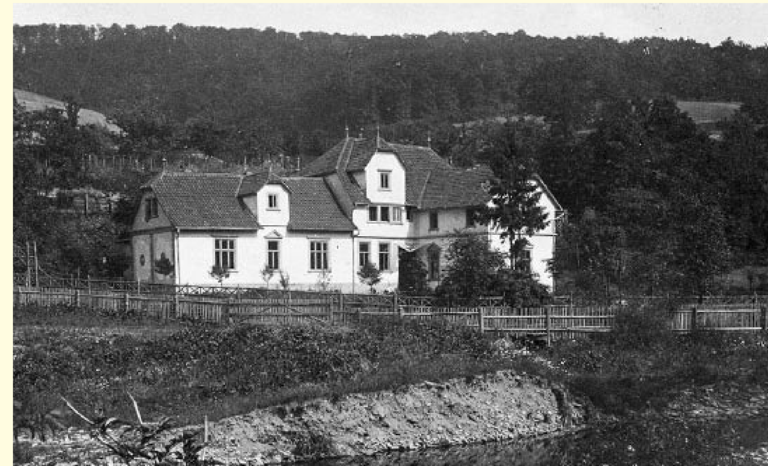
Die Obermühle um 1900