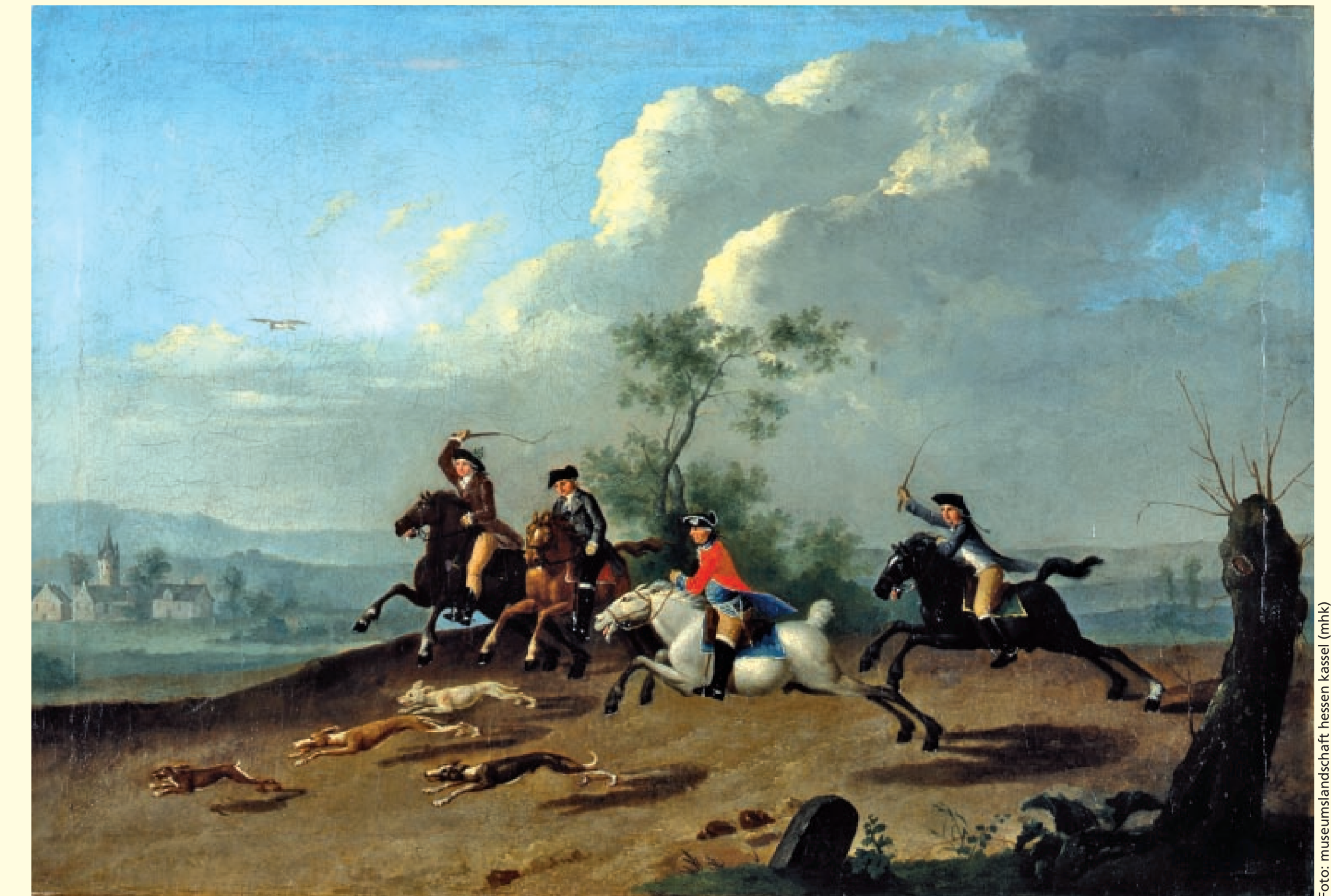
„Landgraf Friedrich II. auf der Hasenjagd“, Gemälde von Johann Heinrich Tischbein d. Ä. (Kassel 1770).

Die höfische Jagd diente am wenigsten der Fleischbeschaffung, sondern vielmehr dem Vergnügen und der Selbstdarstellung des Fürsten oder Jagdherrn: Spezielle Jagduniformen, kostbare Waffen, teure Jagdhunde und -pferde zeugten von seiner wirtschaftlichen und gesellschaftlichen Größe. Zudem war die Jagd ein willkommener Anlass, politische Verbindungen zu knüpfen und zu festigen.