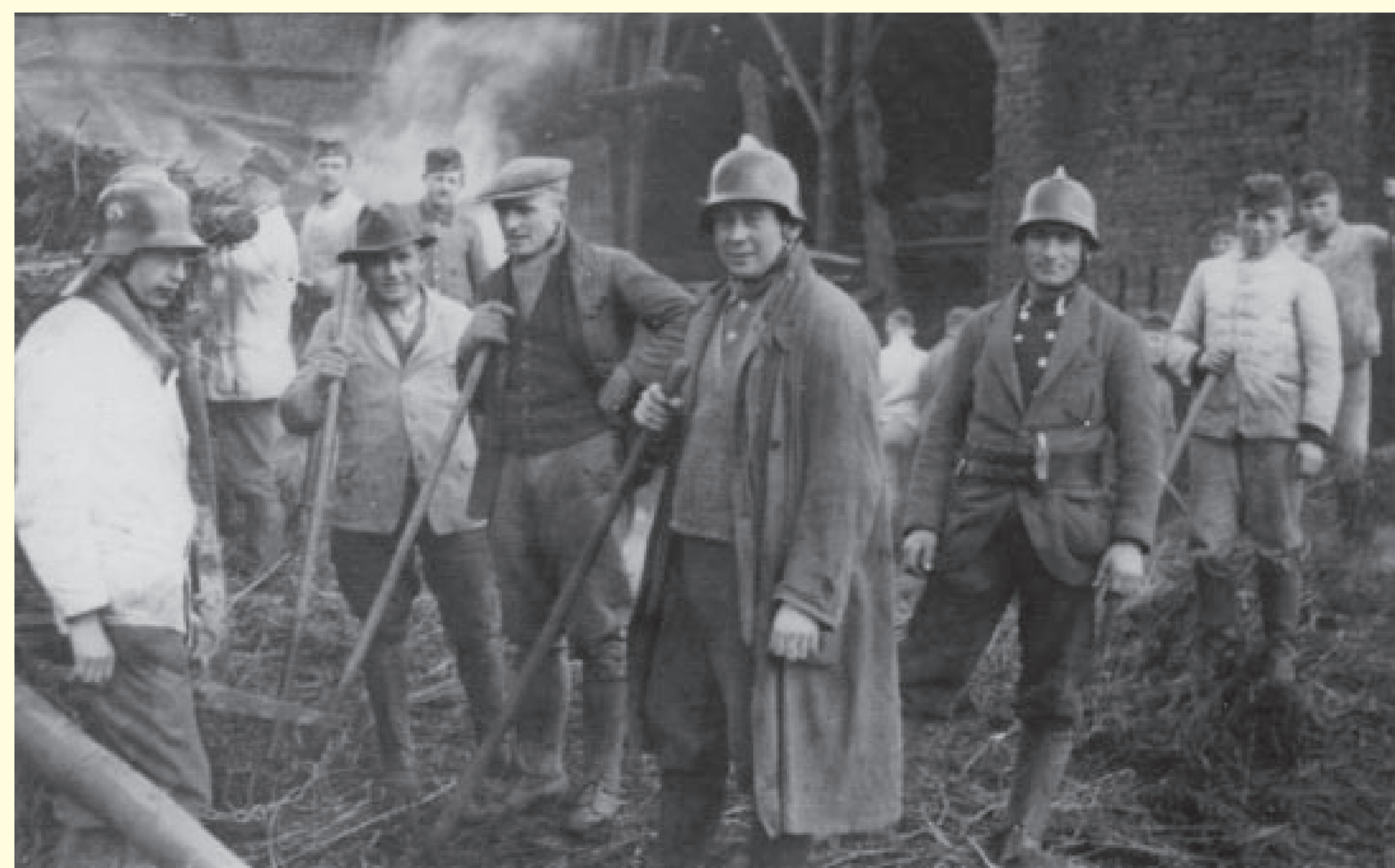
Löscharbeiten eines Großbrands in einem landwirtschaftlichen Betrieb in Vellmar um 1939.

Schließlich empfahl die Grebenordnung von 1739 den Bau von durchgehenden Schornsteinen. Bei der Brandverhütung leistete der Nachtwächter einen wichtigen Beitrag. Seine Aufgabe war es, während der Rundgänge auf Brände zu achten und gegebenenfalls Alarm zu geben.