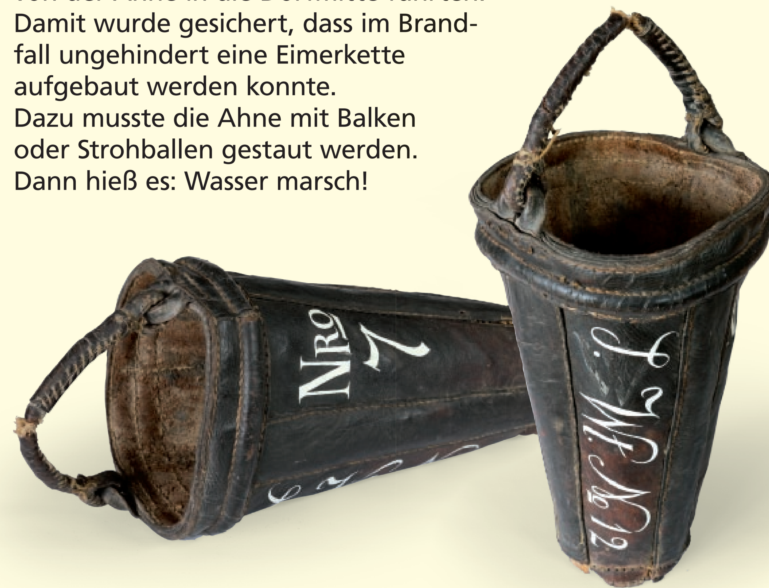
Jeder Hausbesitzer musste einen Ledereimer zur Brandbekämpfung stellen. Er wurde oftmals mit den Hausnummern gekennzeichnet. Dieses Stück ist im Museum Hof Helse, Alte Hauptstraße 22, Obervellmar, ausgestellt. Foto: B. Mietzner, 2015

In Niedervellmar hatte man bei der Bebauung von vornherein schmale Gassen eingeplant, die von der Ahne in die Dorfmitte führten. Damit wurde gesichert, dass im Brandfall ungehindert eine Eimerkette aufgebaut werden konnte. Dazu musste die Ahne mit Balken oder Strohbällen gestaut werden. Dann hieß es: Wasser marsch!